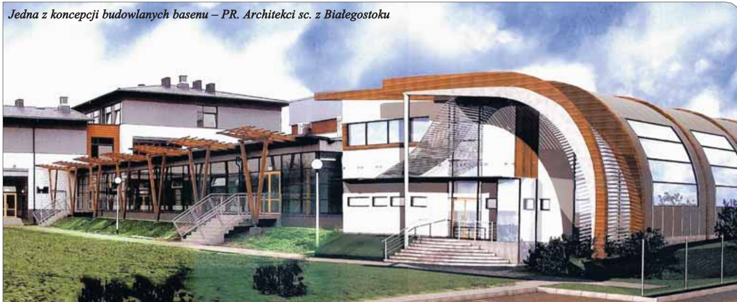
Jedna z koncepcji budowlanych basenu – PR. Architekci sc. z Białogostoku