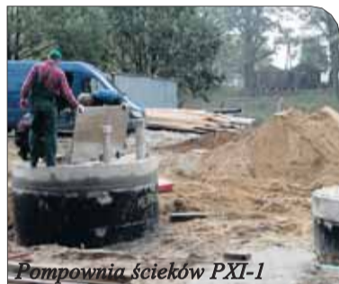
Pompownia ścieków PXP-1

W październiku zakończą się prace przy budowie pompowni ścieków PXP-1 w Białobrzegach. Jest to kolejna inwestycja o charakterze ekologicznym, realizowana w gminie.