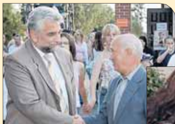
Okazja porozmawiania o kolejnych inwestycjach

Wójt, Rada Gminy Nieporęt, Rady Sołeckie Stanisławowa Drugiego i Woli Aleksandra oraz GOK przygotowały w niedzielę (17.09) festyn rodzinny na terenie filii Gminnego Ośrodka Kultury w Stanisławowie Drugim.