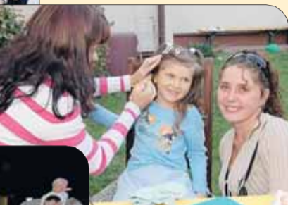
Tygryski czy pies? Malowanie twarzy

po którym na scenie na dobre zagościły zespoły dziecięce i młodzieżowe z Gminnego Ośrodka Kultury. Kulminacją imprezy była zabawa taneczna przy piosenkach zespołu CLASSIC.