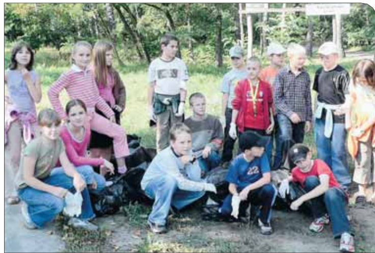
Uczniowie Szkoły Podstawowej Nr 1 w Nieporęcie

ekologicznym uczniom przyznawane są każdego roku odznaki „Przyjacieli przyrody”.