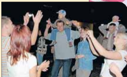
Zabawa pod sceną

Bawiono się od wczesnego popołudnia. Imprezę rozpoczął program rodzinny z konkursami,