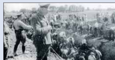
Kopanie rowów przeciwczołgowych na linii umocnień środkowej Wisły.

dzanego w specjalnych brezentowych zbiornikach dla pojazdów walczących wojsk. Ponadto tereny leśne były miejscem postoju czołówek naprawczych sprzętu wojskowego. 9 września marsz. Rokosowski otrzymał od generałów Powowa oraz Gusiewa meldunki iż 47 i 70 Armia są gotowe do dalszych walk o przedpole warszawskie, jednocześnie prowadząc działania rozpoznawcze wobec IV Korpusu Pancernego SS i stwierdzając obsadzenie terenu od Zielonki do Słupna przez 3 Dyw. Panc. SS, a odcinka od Sierakowa do Ryni przez 5 Dw. Panc. SS. Dywizje Waffen SS wspierane były przez jednostki Wehrmachtu m.in. dywizyjny artylerii raketowej, forteczne bataliony saperów, karabinów maszynowych oraz kompanie przeciwpancerne i niszczycieli czołgów. W skład 47 i 70 Armii radzieckiej wchodziły korpusy strzeleckie i brygady pancerne. Koncentracja wojsk radzieckich obejmowała dwa główne zgrupowania, jedno w rejonie Anina a drugie pomiędzy Wólką Radzymańską i Słupnem, gdzie działał 114 Korpus Strzelecki 70 Armii i planowano wprowadzić również 1 Armię Wojska Polskiego.