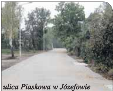
ulica Piaskowa w Józefowie

Na ulicy Sienkiewicza realizowany jest I etap inwestycji – na długości ok. 300 metrów