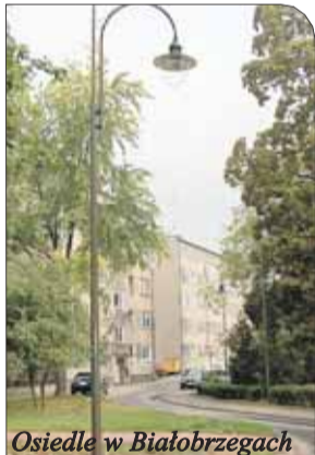
Osiedle w Białobrzegach

Również osiedle w Zegrzu Południowym zyskało nowe oświetlenie. Zamówienie, przewidziane do realizacji