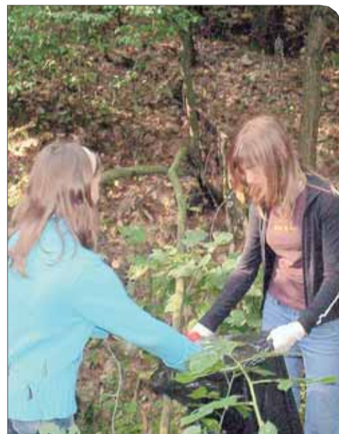
Uczniowie Szkoły Podstawowej w Józefowie (Puszcza Słupecka)

Kilka dni wcześniej, 15 września 2006r. w akcji tej uczestniczy-